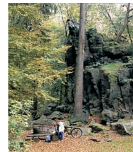
Wilhelmsteine bei Wallenfels

Weitere Informationen bei TOuR GmbH Marburg-Biedenkopf Im Lichtenholz 60 35043 Marburg/Lahn Telefon: 0 64 21/40 53 45 Fax: 0 64 21/ 40 55 09 e-mail: Tourismus@Marburg-Biedenkopf.de