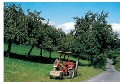
Streuobstwiese bei Bischoffen

Auf den ersten Blick präsentiert sich die alte Kulturlandschaft im Herzen Hessens in ländlicher Unberührtheit. In farbenfrohem Mosaik setzen Bergkuppen und Bäche, Nieder- und Hochwald, Wiesen, Äcker und Feldgehölze, Magerrasenfluren und Streuobstwiesen, betriebsame Städtchen und beschauliche Fachwerkweiler reizvolle Kontraste.