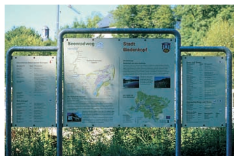
Ortsinfotafel in Breidenstein am Perfstausee

Ortsinfotafeln verführen mit ihren detailreichen Angaben,