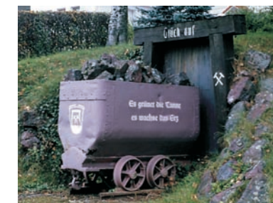
Vom Bergbau in Eisemroth

Ungeachtet der Naturidylle blickt das Lahn-Dill-Bergland zurück auf eine Jahrtausende währende