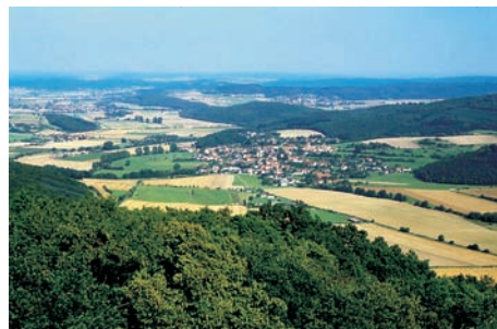
Ausblick vom Rimberg ostwärts

Tief eingeschnittene Täler und steile Kuppen prägen die Ausläufer des Rothhaargebirges und des Lahn-Dill-Berglandes im Westen Marburgs. Vom Rimberg aus eröffnet sich ein großartiger Ausblick sowohl auf das Bergland im Westen wie auch auf die Buntsandsteintafellandschaften, die sich im Osten anschließen. Der Maler Otto Ubbelohde (1867–1922), der als Illustrator von Grimms Märchen zu Weltruf gelangte, ließ sich von der Vielfalt dieser wahrhaft märchenhaften