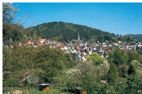
Biedenkopf im oberen Lahntal

Die Begriffe sind Synonyme für die alte, stets jung gebliebene Universitätsstadt Marburg mit ihrer großen, pulsierenden Fülle kultureller Angebote und ihre Umgebung, deren gemeinsames Band die noch junge, springlebendige Lahn bildet.