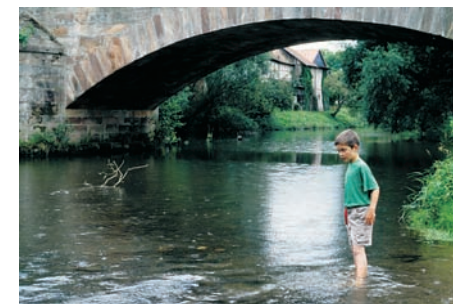
Ein beliebtes Ubbelohde-Motiv: Die alte Lahnbrücke in Goßfelden

Tief eingeschnittene Täler und steile Kuppen prägen die Ausläufer des Rothhaargebirges und des Lahn-Dill-Berglandes im Westen Marburgs. Vom Rimberg aus eröffnet sich ein großartiger Ausblick sowohl auf das Bergland im Westen wie auch auf die Buntsandsteintafellandschaften, die sich im Osten anschließen. Der Maler Otto Ubbelohde (1867–1922), der als Illustrator von Grimms Märchen zu Weltruf gelangte, ließ sich von der Vielfalt dieser wahrhaft märchenhaften